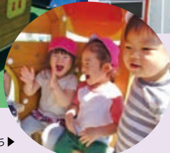
新しい遊具の中で遊ぶ子どもたち▶