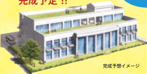
完成予想イメージ