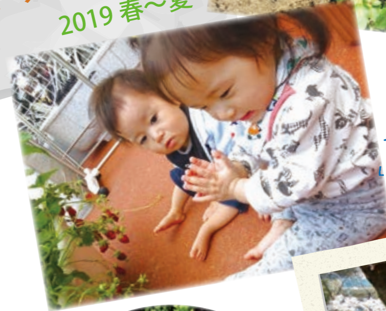
イチゴ いただきます