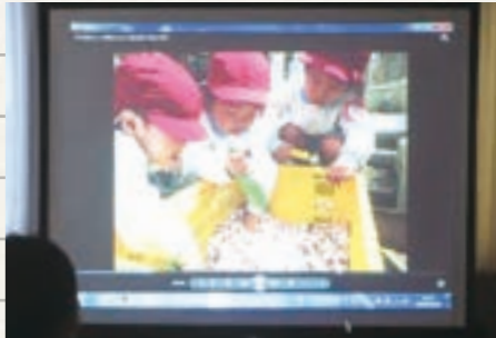
▲DVDを使った各園紹介

都島友の会では2020年度の職員採用に向けて、新たな採用活動をスタートさせました。今年度は、法人の魅力職員自らの声として、そして自らの手で伝えようと、法人説明会に力を入れています。6月と8月に行った説明会では、職員が作成した各園紹介のDVDを上映し、私たちが普段の保育の中でどのようなことに充実感を感じているのか、子どもたちに寄り添う姿、保護者の方々との交流、そして職員同士の親密な繋がりなど、私たちの考える法人の魅力を存分にナレーションや映像で表現、PRしました。また子どもたちに人気の♪パプリカのダンスを上演、実際の保育での取り組みの様子として一緒に踊り体を動かし、体験してもらいました。説明会では、法人の若手職員が一人ひとり、学生から社会人になった際の不安や心配、保育を行う喜びや楽しさなど、自らの体験談を交えて話をし、参加者からは保育者としての心構え、給料についての質問など、同世代ならではの会話も弾み、和やかな空気になりました。お昼はこの春完成したばかりのカフェテリアひまわりで、ランチ会を開催しました。