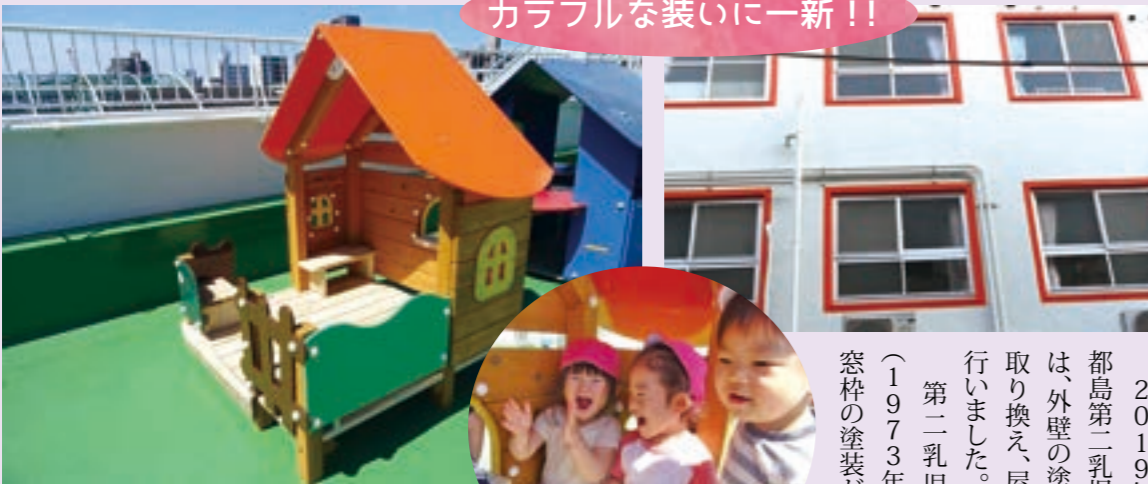
▲防水工事をされた屋上と新しい遊具