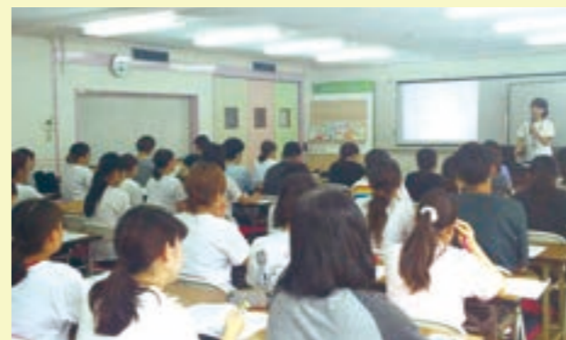
メンタルヘルスケア研修会