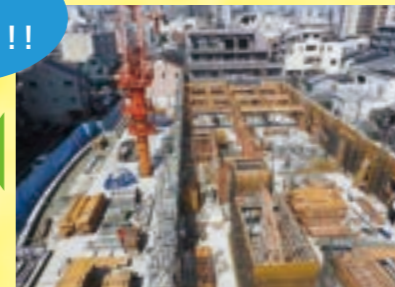
立体的な骨組みができてきました