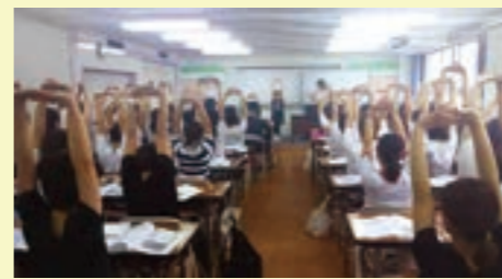
メンタルヘルスケア研修会で行われた「心の体操」

メンタルヘルスとは、「こころの健康管理」を指す言葉です。ストレス社会とも言われる現代では、様々なプレッシャーを受け、メンタル面で問題を抱える方が少なくありません。 メンタルヘルスケアは、働く人すべての「こころの健康」を適切に保ち、いきいきと働くことができる環境を作るための取り組みです。こころが不安定では職務に集中できずに細かなミスを起こし、重大な事故を起こしてしまう恐れもあります。 都島友の会では平成31年度から、法人看護師による予防相談体制を設置、職員のストレスチェック制度の導入など、メンタルヘルスの不調を予防する取り組みを始められています。子どもの健康と安全を守り、健やかな成長を支えるためにも、職員が前向きな気持ちで安定的に保ち、意欲的な姿勢で環境（職場）に適応することが大切だと考えています。