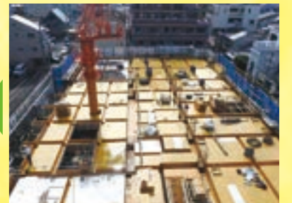
床に鉄板が！建物らしくなってきました