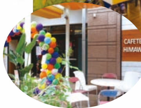
特別養護老人ホームひまわりの郷 1階にオープンした「カフェテリアひまわり」

法人の議決機関である評議員会が、令和元年6月14日に開催され、平成30年度事業報告と決算が承認されましたので、その概要と、併せて平成31年度（令和元年度）事業の進捗状況について報告します。