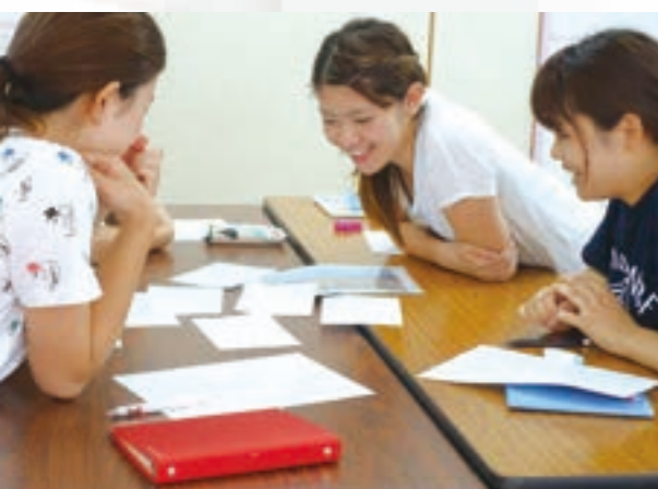
保育士等キャリアアップ研修