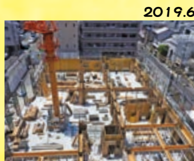
2019.6 工事の風景が日に日に変わっていきます