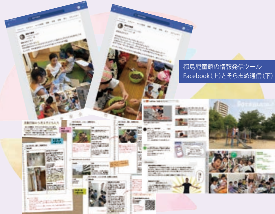
都島児童館の情報発信ツール Facebook(上)とそらまめ通信(下)

数を重ねるうちに日常の様子や仲の良いお友だち、怪我や喧嘩のトラブルなど、様々な子どもたちの様子を共有できる大切な媒介となってきました。 今後は【家庭】【学校】【学童】の連携はもちろん、公園での地域の子ともたちとの関わり、公共施設を積極的に活用するなど、子どもたちの活動の幅が広がる交流も視野にいれ、線ではなく面で、片方向ではなく双方向で、健全な育成に繋がるような様々な人々と協力しながら取り組んでいきたいと思っています。