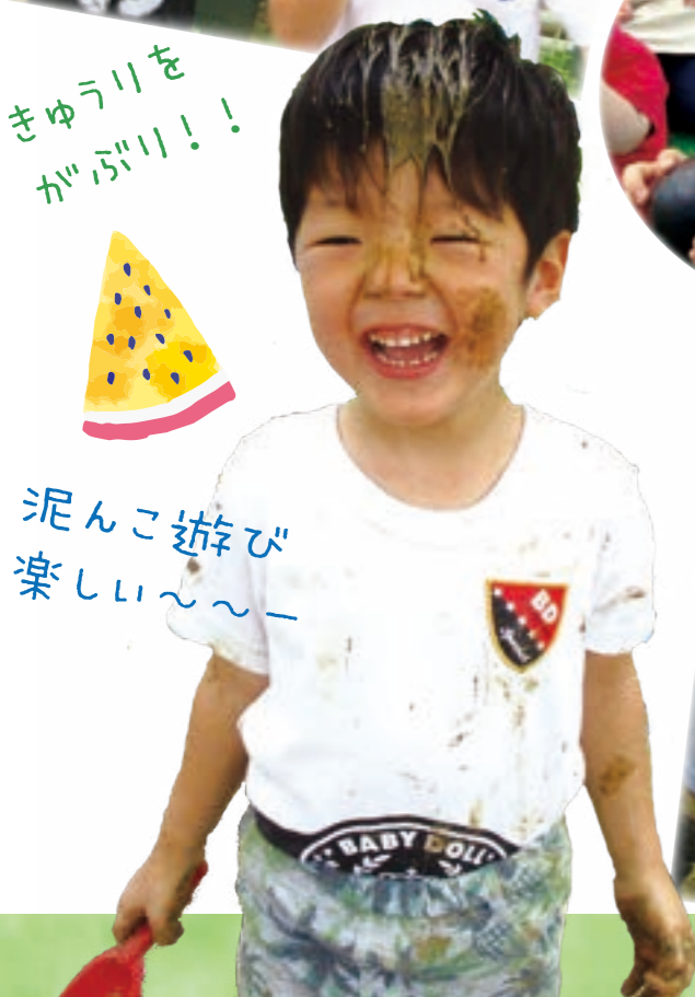
泥んこ遊び 楽しい〜