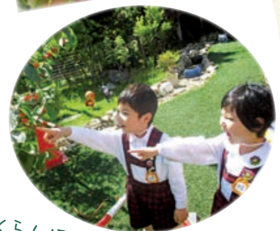
さくらんぼの実が なってるよあ〜