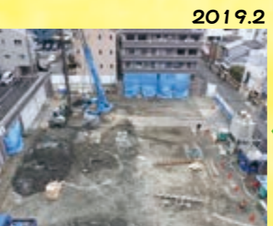
2019.2 クレーン車が登場!!