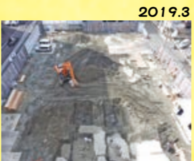
2019.3 更地になりました