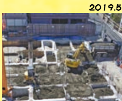
2019.5 大きなクレーン車が設置されました