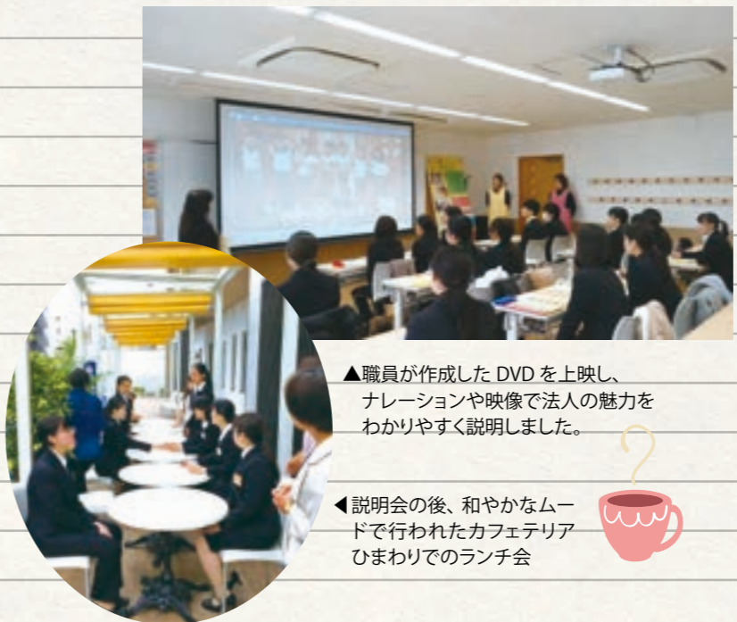
▲職員が作成したDVDを上映し、ナレーションや映像で法人の魅力をわかりやすく説明しました。

法人には35年以上の伝統を誇るバレーボール部があります。先輩方が「保育だけでなく、みんなが楽しめるレクリエーションも」とつくってくださいました。その想いは今も受け継がれ、メンバーが入れ替わりながらも、年齢・役職を問わず、ボールを追いかけて、汗を流し、皆で「青春」をしています。今年も7月7日(日)、第44回大阪民間社会福祉事業従事者共済会バレーボール大会が開催され、「ひまわり会MIYAKO」「ひまわり会SII-MA」の2チームが参加をしました。試合に向け、都島区のママさんバレーボール部の方々と練習試合をさせていただき、「チームの力を発揮するのは今でしょ!」と心を一つに頑張りましたが、力及ばず…。今年「ひまわり会MIYAKO」が3位という結果に終わりました。「なぜ、仕事終わりのゆっくりしたい時間にクラブ活動?」と疑問に思われる方もいらっしゃると思いますが、「ひとつの目標に向かって好きなことを楽しむ」仕事への活力・ストレス発散!心も身体もリフレッシュに繋がること、また、「法人内のたくさんの職員・地域の方との関わり」チームワークを育み保育の幅を広げ、地域に根ざした社会福祉法人に繋がっていること。それが、クラブ活動の魅力です。来年こそチーム力No.1で、輝く金メダルを手に入れられるよう、頑張っていきたいと思っています。