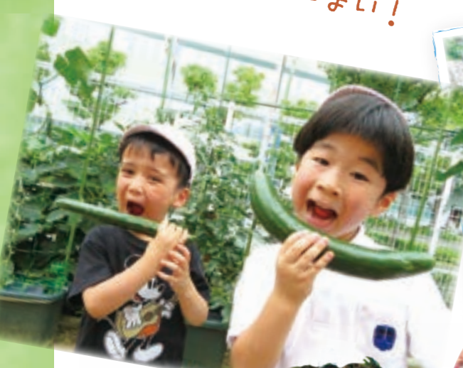
きゅうりを かぶり!!