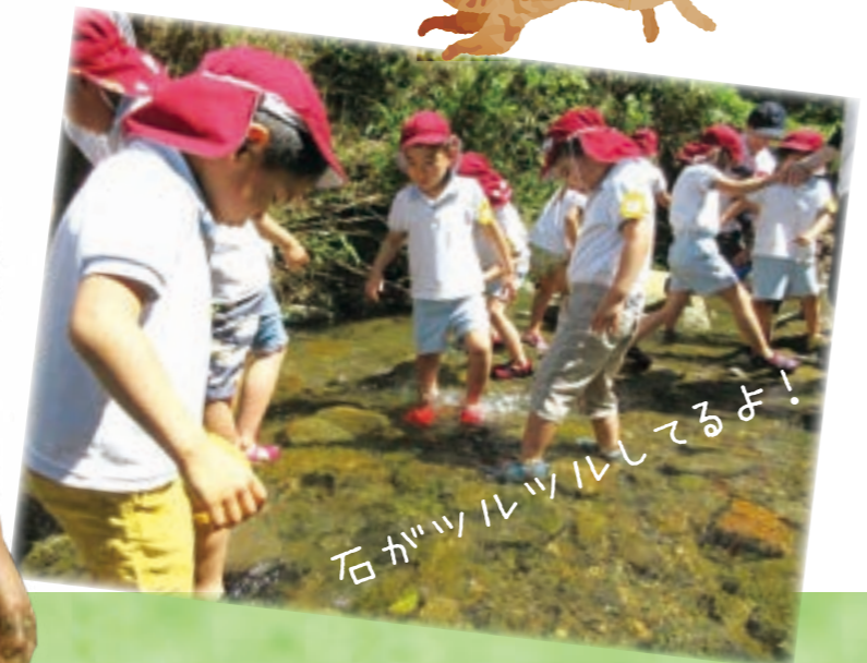
石がツルツルしてるよ!