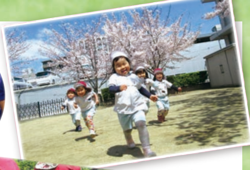
ふかふかの 草のじゅうたん