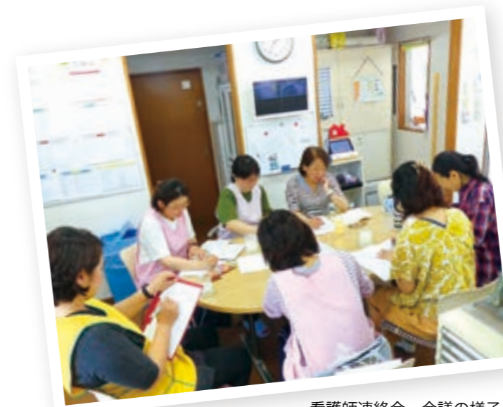
看護師連絡会 会議の様子

都島友の会の保育施設には現在9名の看護師が在籍しています。月に一度、各園の看護師が集まり、情報交換や問題を共有し、話し合う機会を作っています。看護師一人であれば難しいことも、各園の看護師が1つの場に集まり、情報交換や意見交換を行うことで、看護師同士の繋がりも深まり、より活発な保健活動を行うことができると思っています。 近年、子どもたちを取り巻く環境が大きく変化する中で、保護者の就労実態に合わせた長時間保育やアレルギーなどの対応が必要とされる子どもが増えていること、障がい児保育の低年齢化など、ニーズも多様化し、その対応が保育施設に求められています。 私たち法人の看護師は、保育施設に勤務する看護師として、保育保健の視点から、子どもの健康と安全を守り、健やかな成長を支えるためには、感染対策、事故防止、子どもおよび職員自身の健康管理など職員への保健研修の重要性を強く感じています。 子どもが生涯にわたり心身ともに健康な生活を送るための基礎は、乳幼児期に形成されると言われており、子どもの発達過程に即した養護と教育の両面から健康支援を行うことは重要です。このような大切な時期に子どもたちに関わる保育施設に勤務する看護師の役割は大きいと考えています。