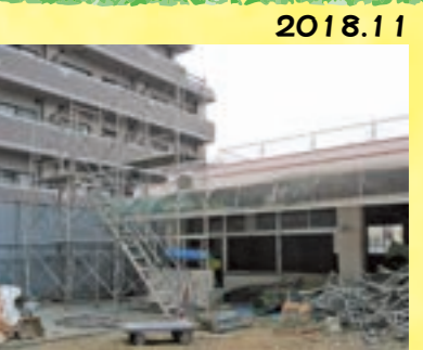
2018.11 少しずつ園舎が壊されていきます