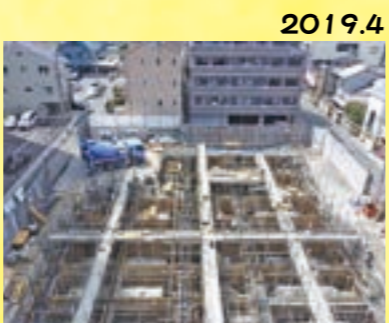
2019.4 基礎工事がスタート