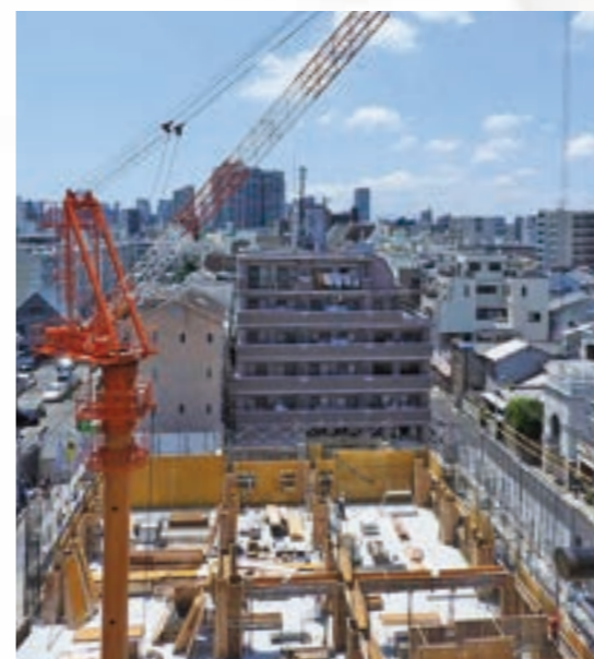
新園舎建替工事の様子

令和3年の法人創立90周年に向け、施設の新築建替と改修等環境整備を進めています。 平成30年度は、都島東保育園・こども発達サポートステーションそれいゆの建替工事に着手しました。鉄筋コンクリート4階建て、延床面積は約2,200平方メートル。令和元年12月には、大きなホールを備えた新園舎が完成する予定です。友淵児童センターでは外壁等の塗装、厨房の全面改修を実施。友淵乳児保育センターは、厨房改修を実施しました。