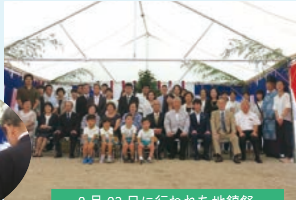
8月23日に行われた地鎮祭