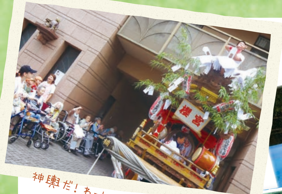
神輿だ! あっしょい!